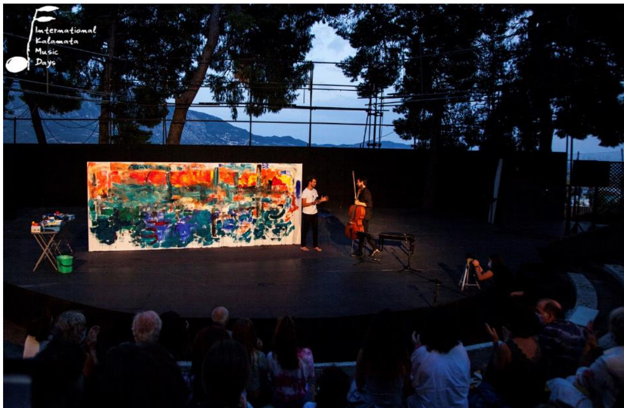
πάνω: Ο Jérémié Queyras στην παράσταση «Τα χρώματα του ήχου» (27 Σεπτεμβρίου 2020, Αμφιθέατρο Κάστρου Καλαμάτας), κάτω: Οι Jean-Guihen Queyras και Jérémié Queyras στην ίδια παράσταση (27 Σεπτεμβρίου 2020, Αμφιθέατρο Κάστρου Καλαμάτας)