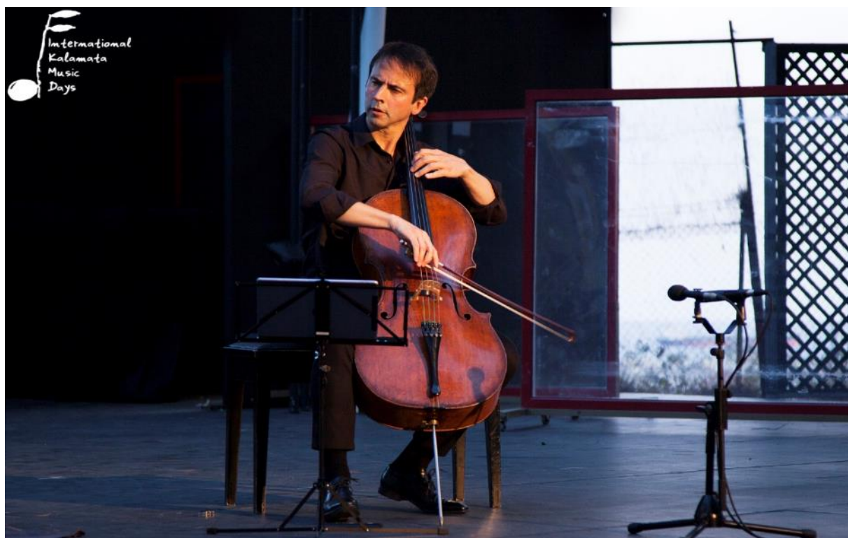
πάνω: Οι Ιόνιαν Ηλίας Καντέσα, Tim Crawford, Pablo Hernán και Vashti Hunter κατά τη διάρκεια της συναυλίας «Ιόνιαν Ηλίας Καντέσα & Σύνολο Δωματίου CAERUS» (26 Σεπτεμβρίου 2020, Αμφιθέατρο Κάστρου Καλαμάτας), κάτω: Ο Jean-Guïhen Queygas στην παράσταση «Τα χρώματα του ήχου» (27 Σεπτεμβρίου 2020, Αμφιθέατρο Κάστρου Καλαμάτας)